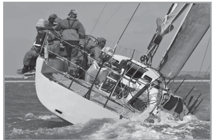
Na een dagje luieren en helemaal niets doen een actieve Balansdag

Een dagje lekker luieren en helemaal niets doen kan zo nu en dan best. Combineer je zo'n dagje luieren met een uitgebreide barbecue en wat extra roseetjes op het strand? Neem dan direct de volgende dag een Balansdag. Natuurlijk huur je dan geen scootertje, maar ga je er te voet of op de fiets op uit om de omgeving te ontdekken. En je eet natuurlijk minder.