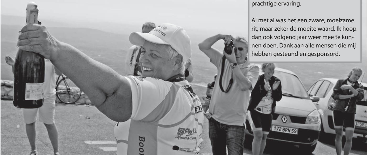
Champagne op de top voor Bep

Al met al was het een zware, moeizame rit, maar zeker de moeite waard. Ik hoop dan ook volgend jaar weer mee te kunnen doen. Dank aan alle mensen die mij hebben gesteund en gesponsord.