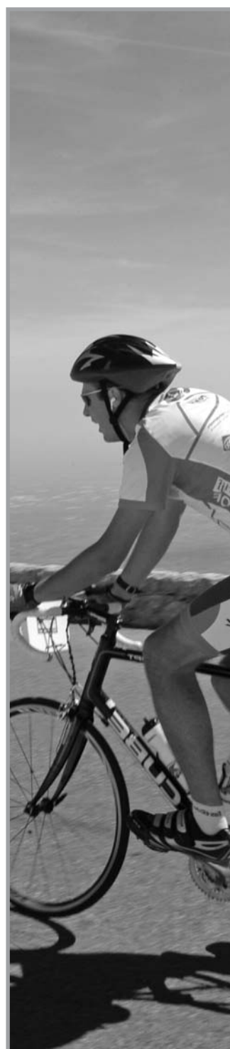
Kyros in actie

Maar bovenop vervallen de verschillen Talent is ook een vorm van heel graag willen