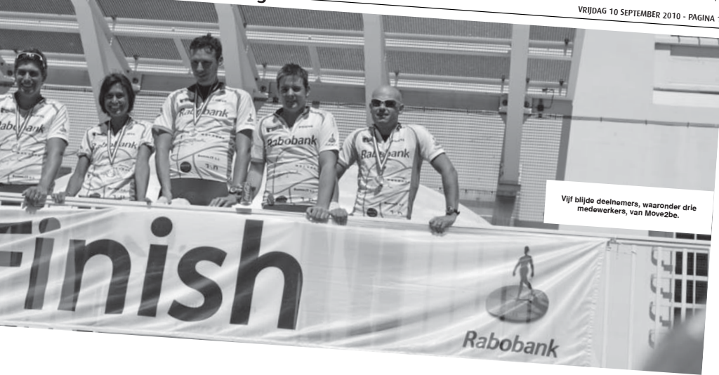
Vijf bijde deelnemers, waaronder drie medewerkers van Move2be.